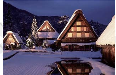
Shirakawa-go ~ 白川鄉 ~ 搭巴士 55+50 分鐘