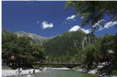
Kamikouchi ~ 上高地 ~ 搭巴士 25 分鐘