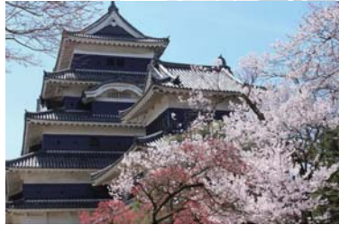
Matsumoto-castle ~ 松本城 ~ 搭巴士 75+10 分鐘