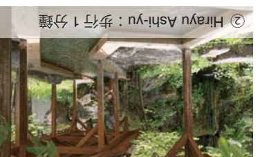
② Hirayu Ashi-yu：步行 1 分鐘

平湯溫泉 中村館 岐阜縣高山市 與飛驒溫泉鄉平湯 728 番地 TEL +81(0) 578-89-2321 FAX +81(0) 578-89-3022