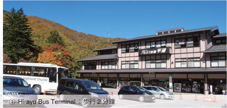
① Hirayu Bus Terminal：步行 2 分鐘

通往讓您感受日本歷史的飛驒高山，世界遺產的白川鄉，能環山漫遊充分享受雄偉自然的上高地，乘鞍岳新穗高，等等，非常方便