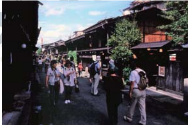
Takayama ~ 飛驒高山 ~ 搭巴士 55 分鐘