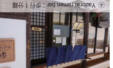
④ Yadoriki ramen bar：步行 1 分鐘