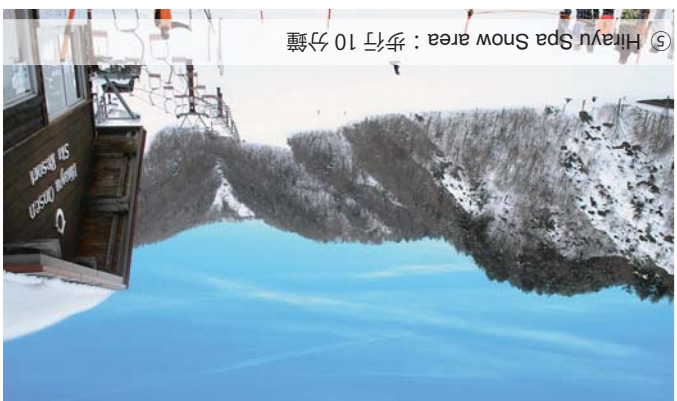
⑤ Hirayu Spa Snow area：步行 10 分鐘