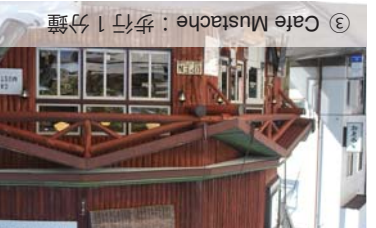
③ Cafe Mustache：步行 1 分鐘