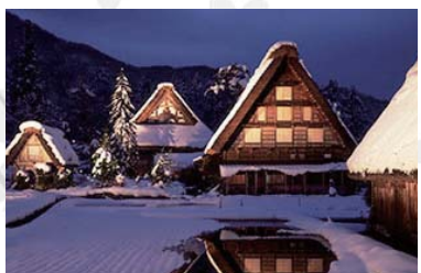
Shirakawa-go ~ 白川郷 ~ 乘公共汽车的 55+50 分钟