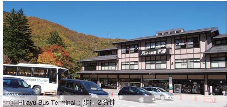
① Hirayu Bus Terminal : 步行 2 分钟

通往让您感受日本历史的飞騨高山，世界遗产的白川乡，能环山漫游充分享受雄伟自然的上高地，乘鞍岳新穗高，等等，非常方便。