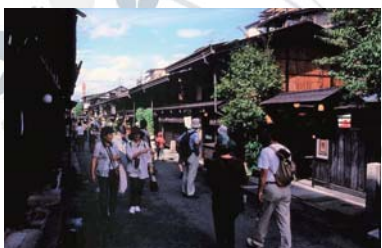
Takayama ~ 飛騨高山 ~ 乘公共汽车的 55 分钟