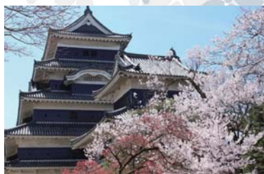
Matsumoto-castle ~ 松本城 ~ 乘公共汽车的 75+10 分钟