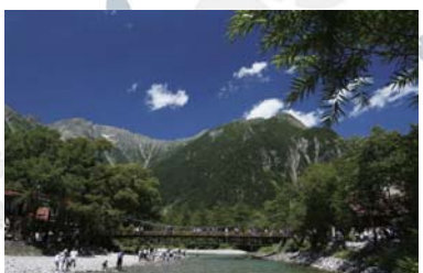
Kamikouchi ~ 上高地 ~ 乘公共汽车的 25 分钟