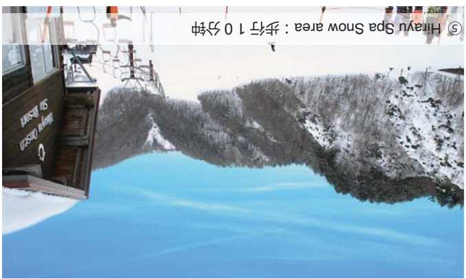
⑤ Hirayu Spa Snow area : 步行 10 分钟